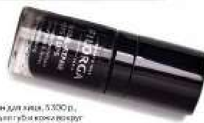
Лосьон для лица, 5 300 р., и крем для губ и кожи вокруг глаз, 6 000 р., все — Global- Repair, Filorga